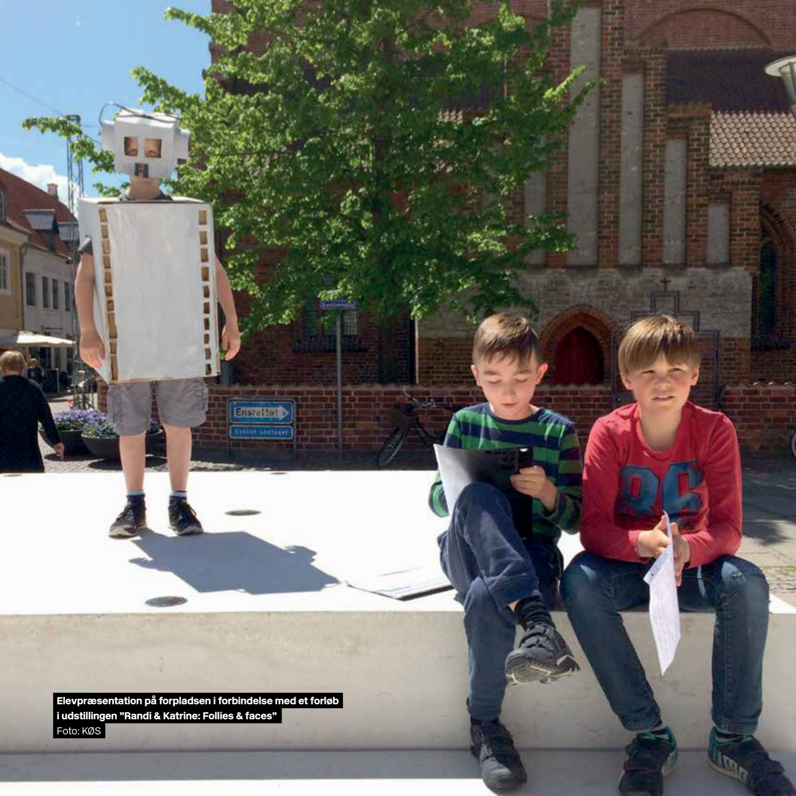
Elevpræsentation på forpladsen i forbindelse med et forløb i udstillingen "Randi & Katrine: Follies & faces"