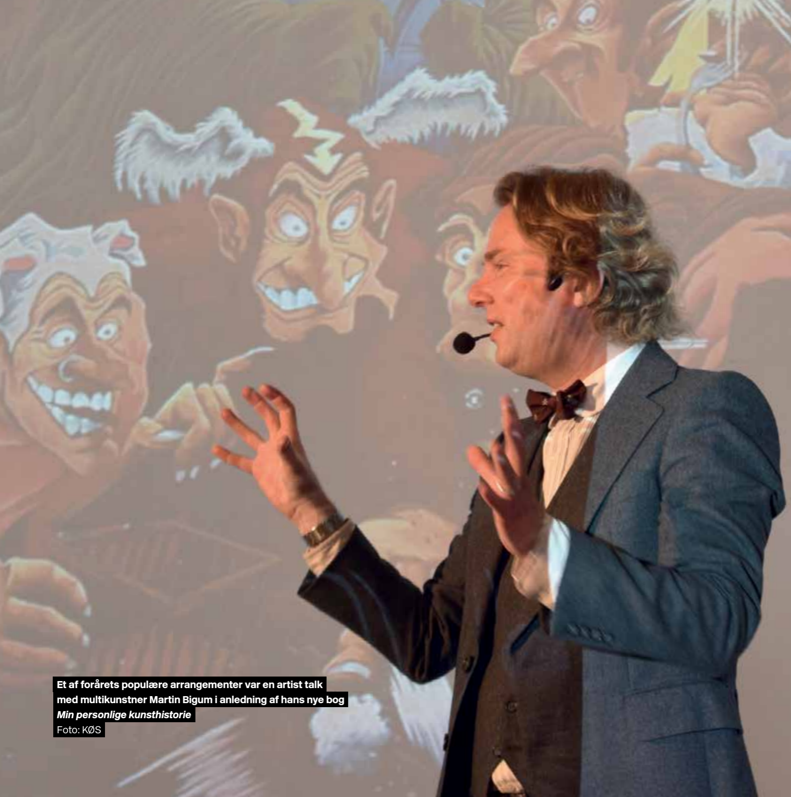
Et af forårets populære arrangementer var en artist talk med multikunstner Martin Bigum i anledning af hans nye bog Min personlige kunsthistorie