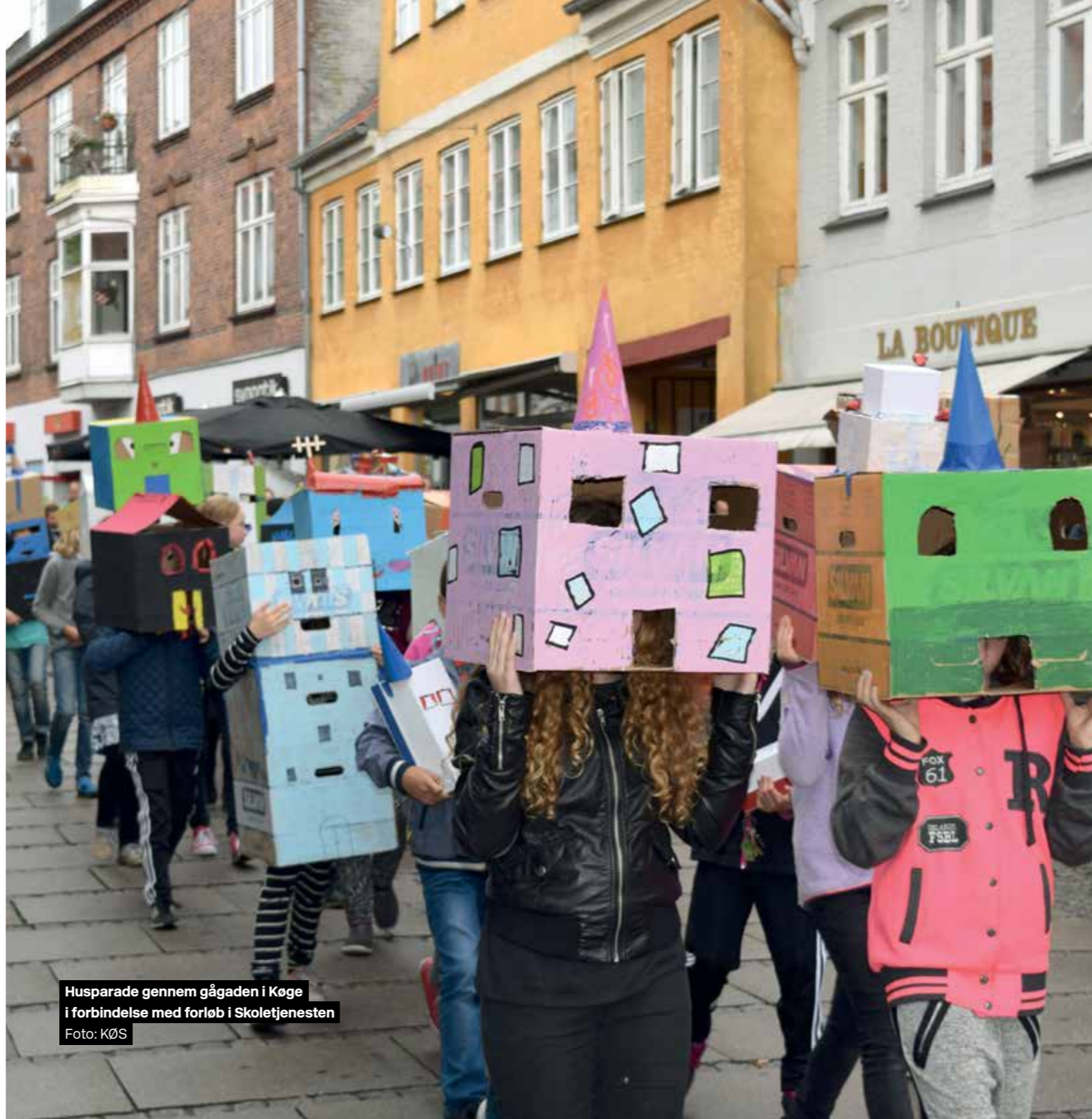
Husparade gennem gågaden i Køge i forbindelse med forløb i Skoletjenesten