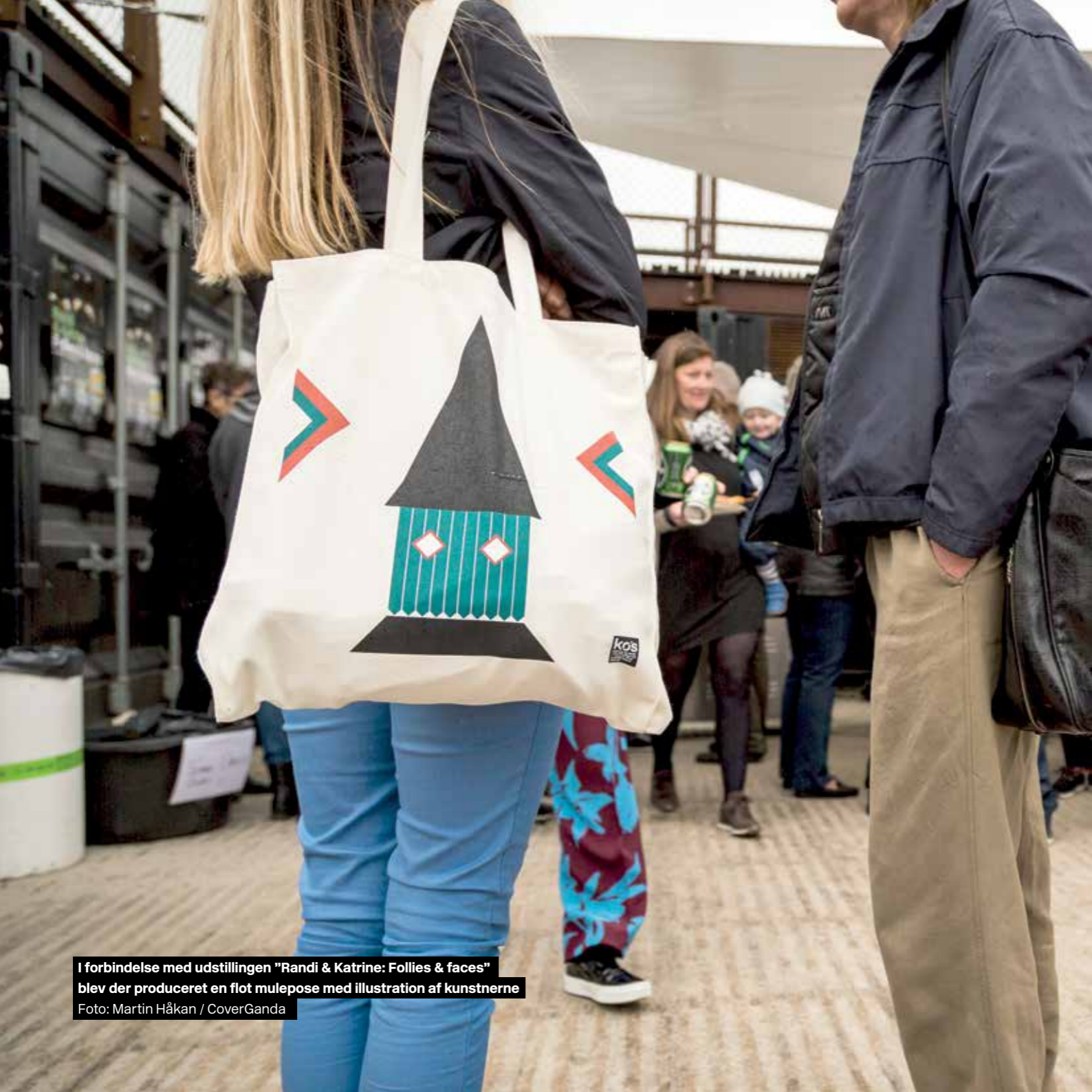
I forbindelse med udstillingen "Randi & Katrine: Follies & faces" blev der produceret en flot mulepose med illustration af kunstnerne