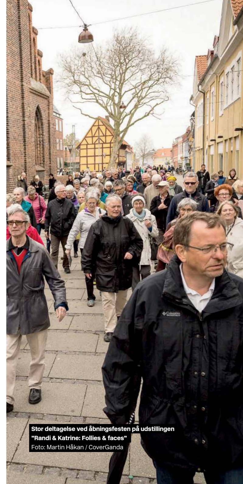
Stor deltagelse ved åbningsfesten på udstillingen