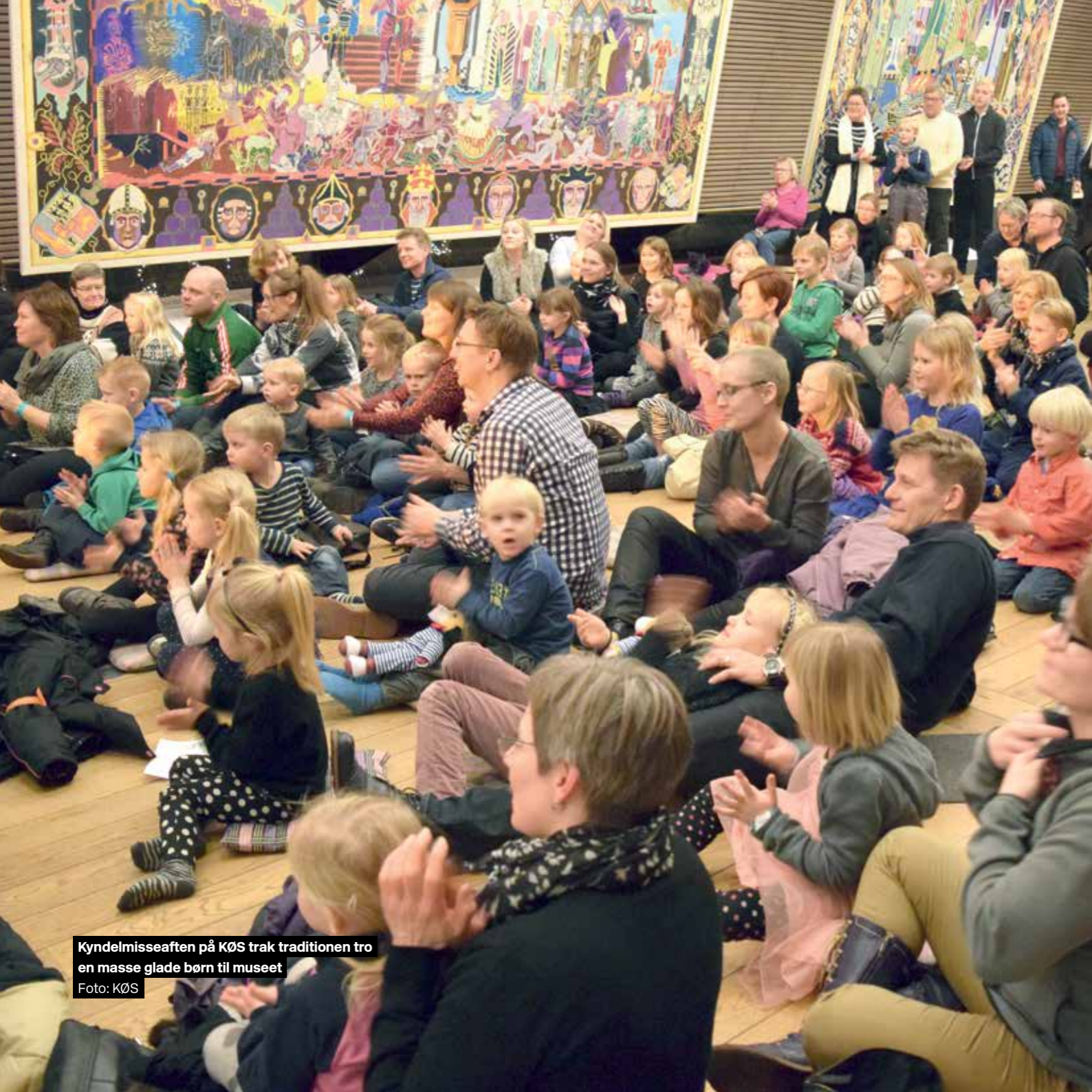
Kyndelmisseaften på KØS trak traditionen tro en masse glade børn til museet