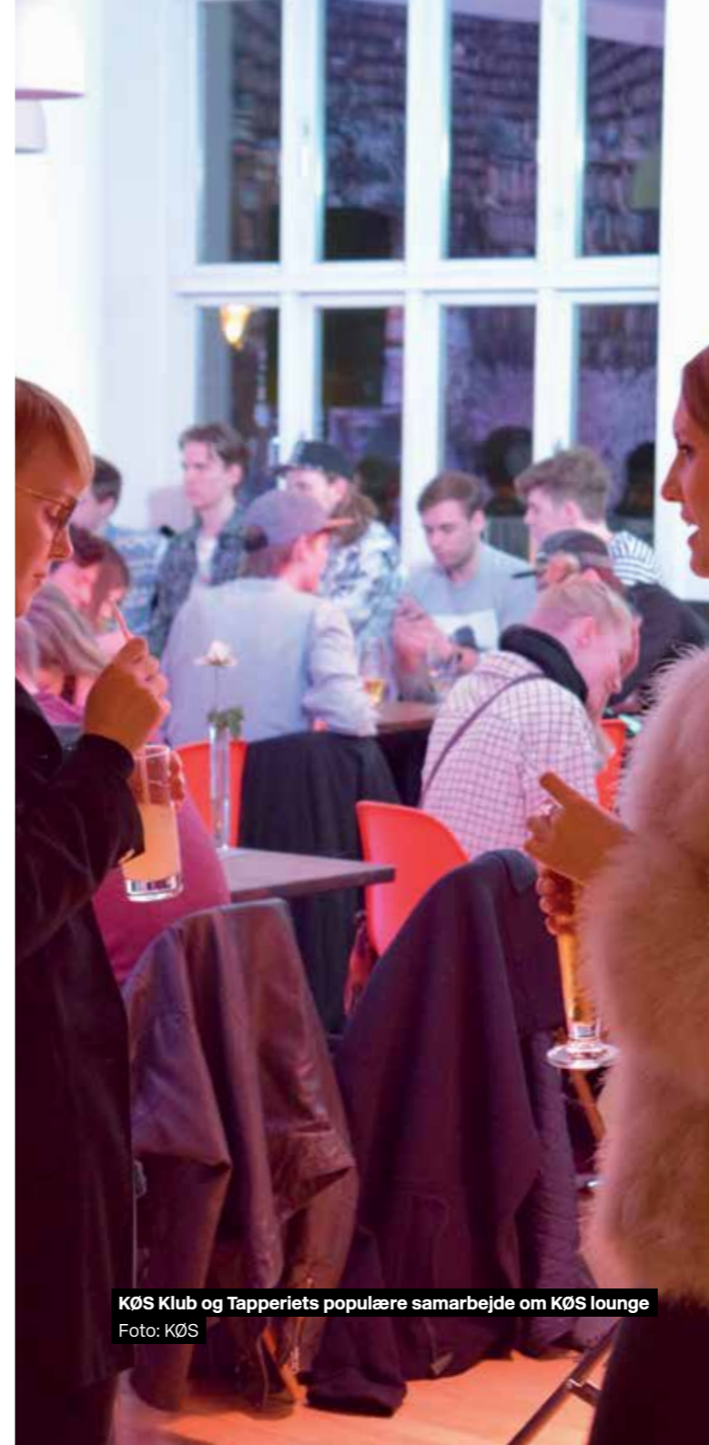
KØS Klub og Tapperiets populære samarbejde om KØS lounge

Bjørn Nørgaards kartoner til Dronningens Gobeliner: 32 Randi & Katrine: Folies & faces: 30 15 favoritter fra samlingen: 8