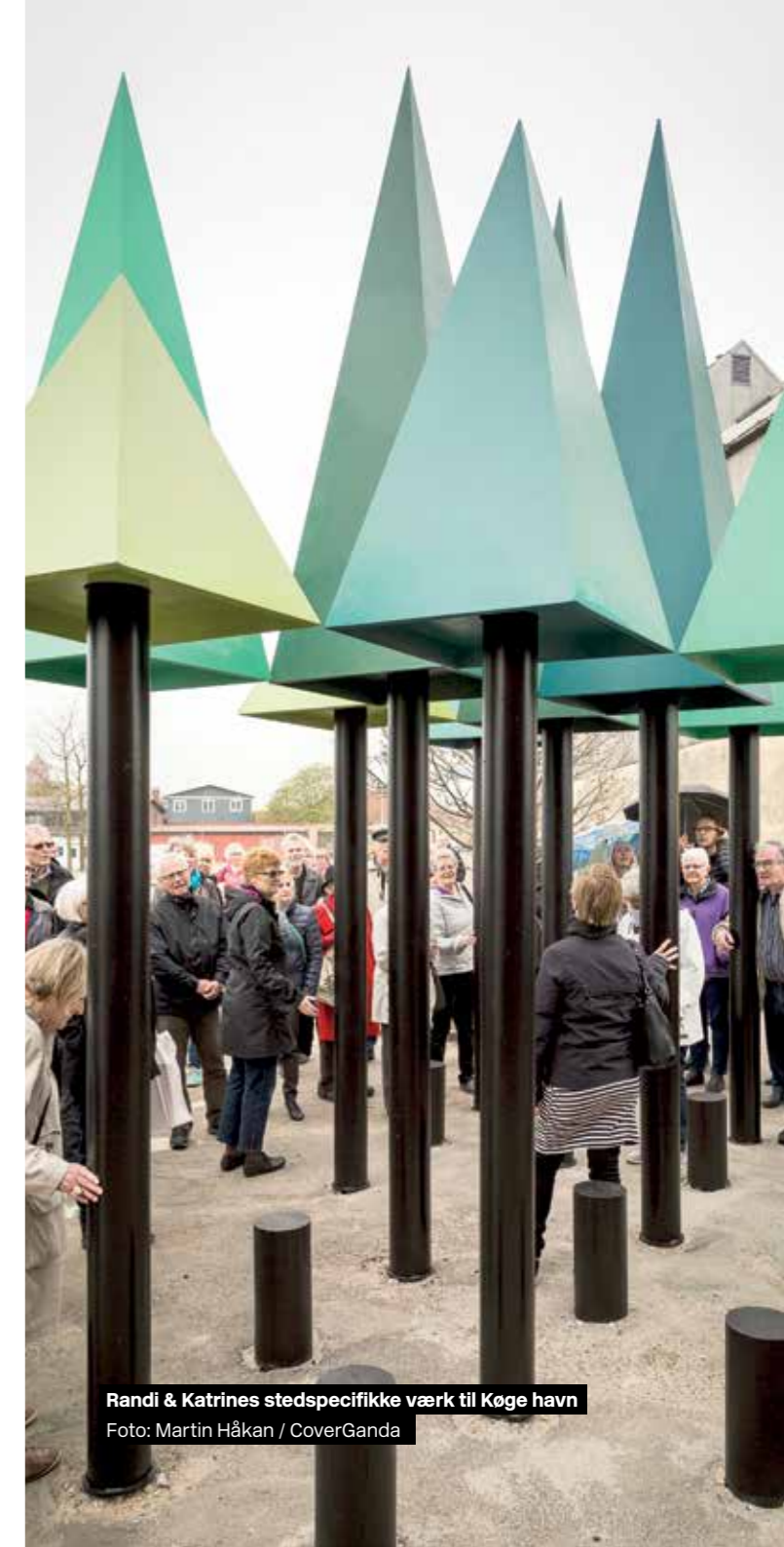
Randi & Katrines stedspecifikke værk til Køge havn

I 2015 havde museet 46.553 besøgende. Heraf var 31.693 på museet og 14.860 udenfor museet ifb. den store udendørs udstilling "Randi & Katrine: Follies & faces".