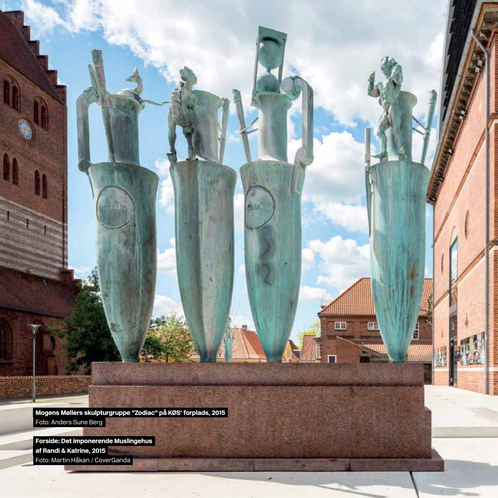
Mogens Møllers skulpturgruppe "Zodiac" på KØS' forplads, 2015