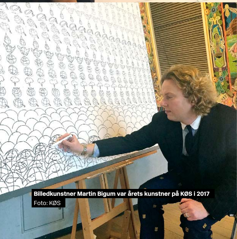
Billedkunstner Martin Bigum var årets kunstner på KØS i 2017