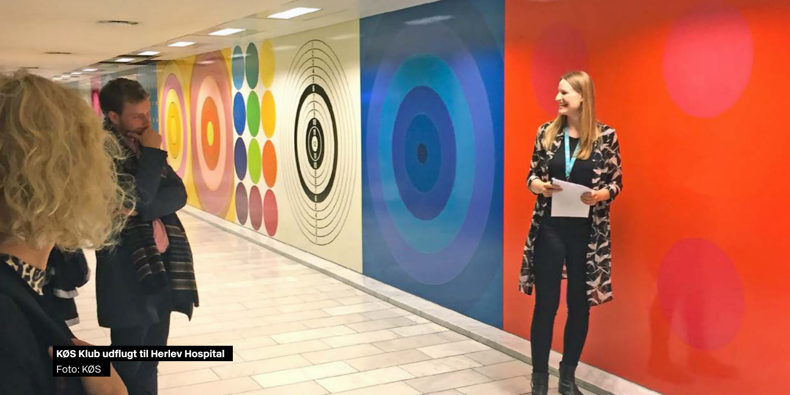
KØS Klub udflugt til Herlev Hospital