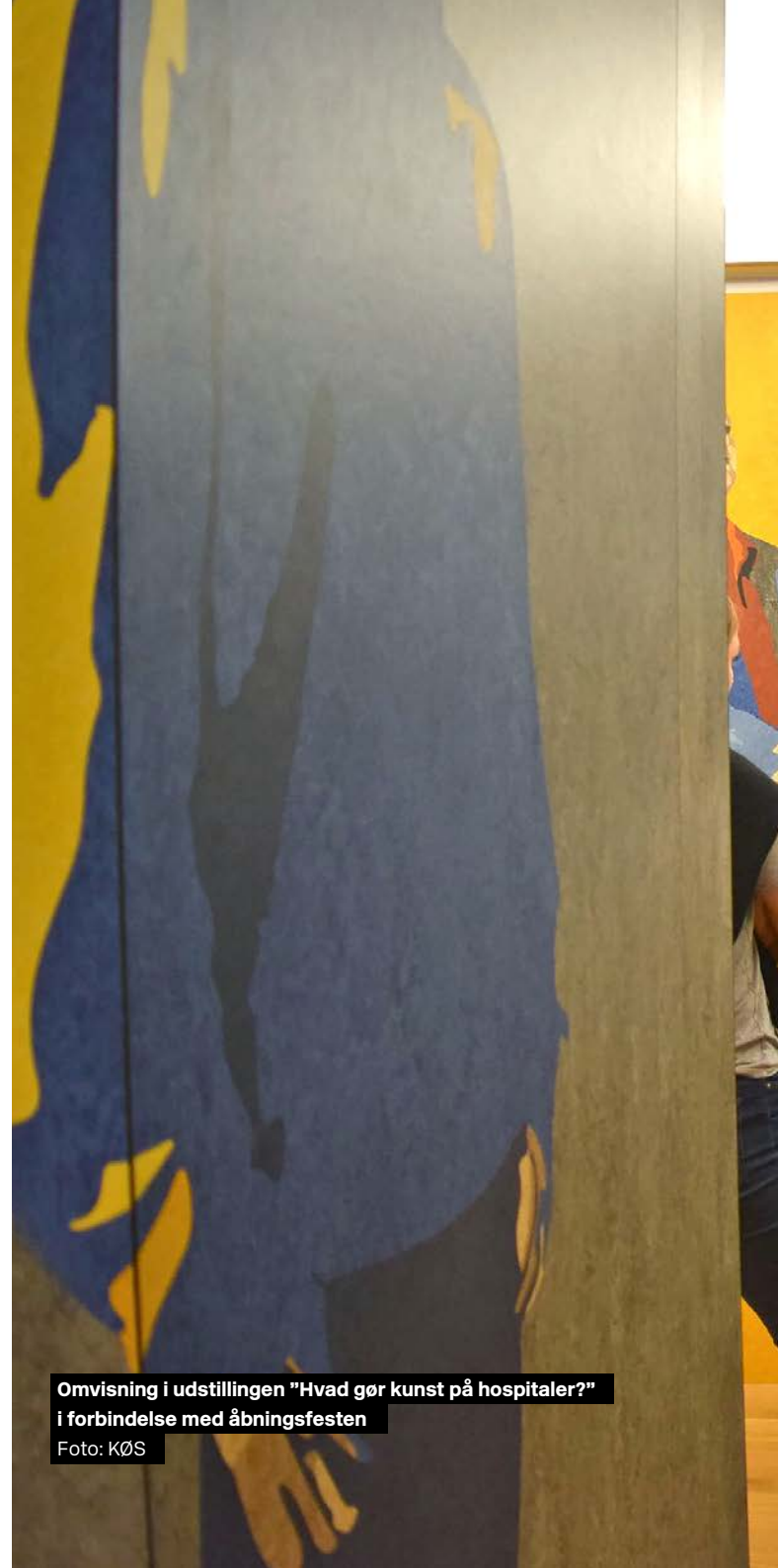
Omvisning i udstillingen "Hvad gør kunst på hospitaler?" i forbindelse med åbningsfesten