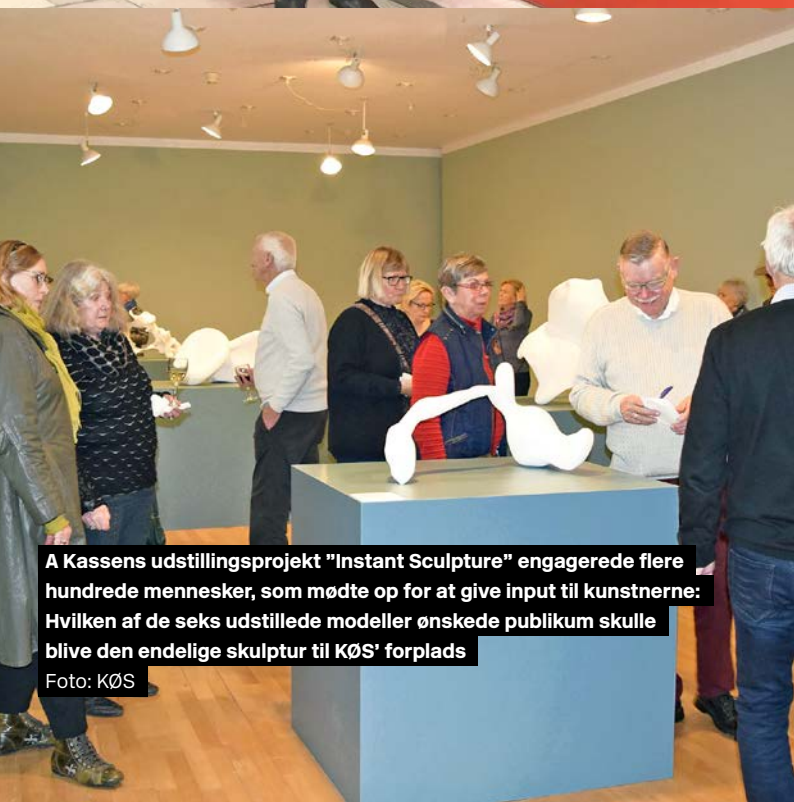
A Kassens udstillingsprojekt "Instant Sculpture" engagerede flere hundrede mennesker, som mødte op for at give input til kunstnerne: Hvilken af de seks udstillede modeller ønskede publikum skulle blive den endelige skulptur til KØS' forplads